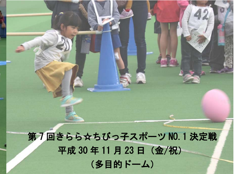
第 7 回きらら☆ちびっ子スポーツ NO.1 決定戦 平成 30 年 11 月 23 日(金/祝) (多目的ドーム)