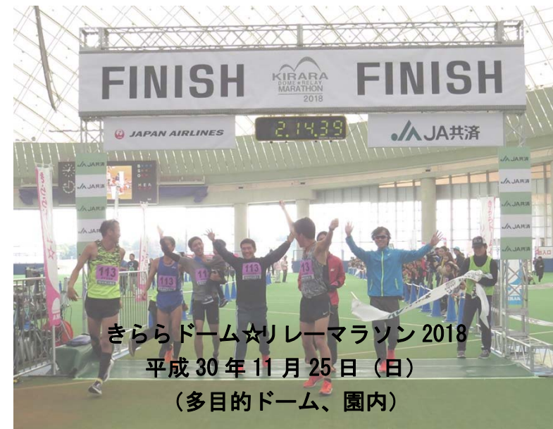
きららドーム☆リレーマラソン 2018 平成 30 年 11 月 25 日(日) (多目的ドーム、園内)